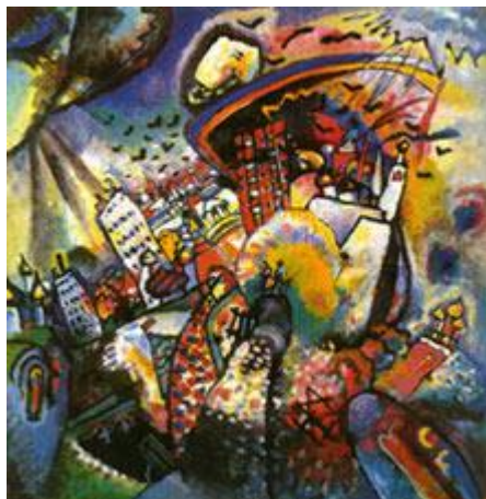
Moscovo I - 1916 Óleo sobre tela Tam. 51,5 x 49,5 cm