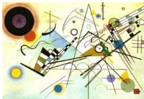
Composição VIII - 1923 Óleo sobre tela Tam. 140 x 201 cm

Em 1903, na Sétima "Expoisição Phalanx" expõe quadros de Claude Monet. Após o encerramento da "Escola de Pintura Phalanx", Kandinsky é convidado por Peter Behrens para dirigir uma aula de Pintura decorativa na Escola de Artes e Ofícios de Dusseldórfia, recusando, contudo, o convite. Em 1904, na nona "Exposição Phalanx", dedicada a Alfred Kubin, Kandinsky expõe