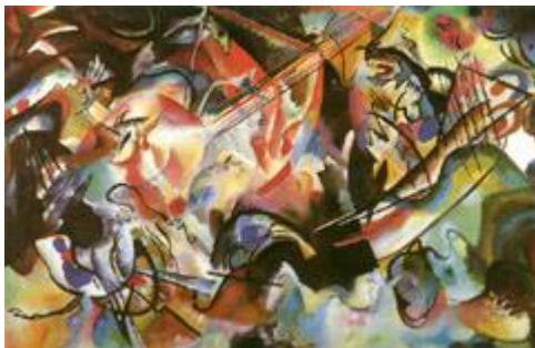
Composição VI - 1913 Óleo sobre tela Tam. 195 x 300 cm

Em 1895 trabalha como diretor artístico da Editora Kucherev, em Moscovo. No ano seguinte rejeita um convite para ensinar na Universidade de Dorpat para se dedicar ao estudo de pintura. Muda-se para Munique e inicia estudos artísticos na Escola de Azbè.