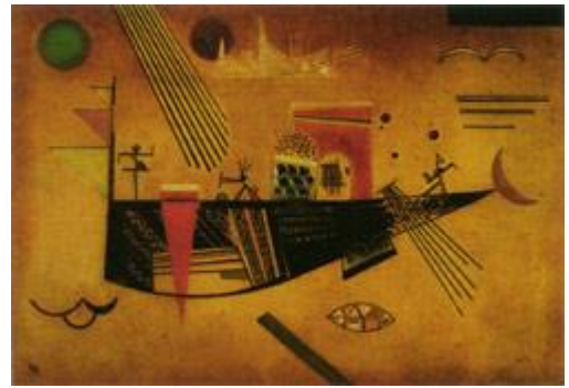
Capricho - 1930 Óleo sobre tela Tam. 40,5 x 56 cm

Kandinsky nasce dia 4 de Dezembro de 1866, em Moscovo, no seio de uma família, cujo chefe era negociante de chás. Em 1871, a família muda-se para Odessa. Os pais se divorciam e a tia de Kandinsky se encarrega de sua educação. Logo, de 1876 a 1885, Kandinsky recebe as primeiras aulas de desenho e música e em 1886 começa os estudos de Direito e