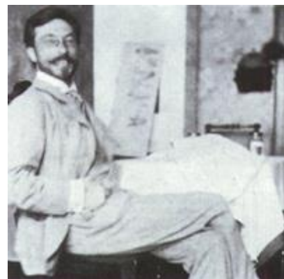
Kandinsky em Dresden, 1905