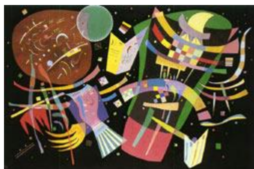
Composição X - 1939 Óleo sobre tela Tam. 130 x 195 cm

Participa na exposição da "Associação dos Artistas" de Moscovo. Torna-se membro da "Federação dos Artistas Alemães" em 1905. Expõe no Salon des Indépendants em Paris. Em 1906 viaja com Münter para Paris, onde moram até ao final do ano. Expõe em inúmeras exposições, como o "Salão de Outono" em Paris, com artistas da "Brücke" em Dresden e da "Secessão" em Berlim. Apresenta 109 trabalhos no Musée du Peuple de Angers. Vive com Münter de Setembro de 1907 a Abril de 1908, em Berlim. Expõe seus trabalhos de Março a Maio no "Salon des Indépendants" de Paris. De meados de Agosto ao final de Setembro, Kandinsky, Münter, Jawlensky e Werefkin trabalham em Murnau.